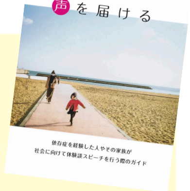
依存症を経験した人やその家族が 社会に向けて体験談スピーチを行う際のガイド

仲間の中ではなく、一般の人の中で自分の体験談を話すとき、知らず知らずの間に再トラウマ化・再発・傷つき体験をすることが多くあります。そのことに注目し、私たちが社会でメッセージをちゃんと伝え、そして傷つかないようにするためのガイドブックを作りました。「とにかく体験談を話すことは良いこと」という風に考えている支援者やイベント主催者の方も多量中、本人も高揚する感覚に紛れて、自身が傷ついていることに気がつかないことがほとんどです。